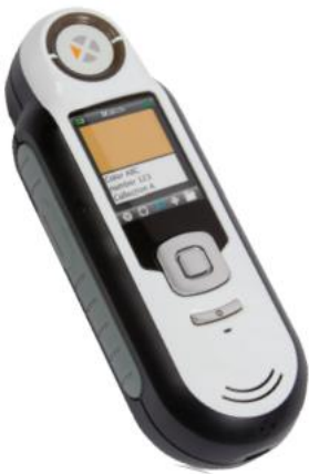
Customized Special version RM200 Series